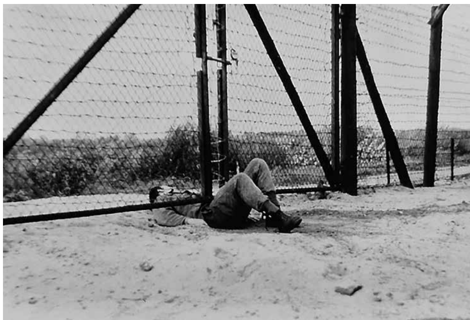
Obr. 4: Fotografie z rekonstrukce (ABS, f. Správa vyšetřování StB – vyšetřovací spisy, arch. č. V-18596 MV, s. 170)