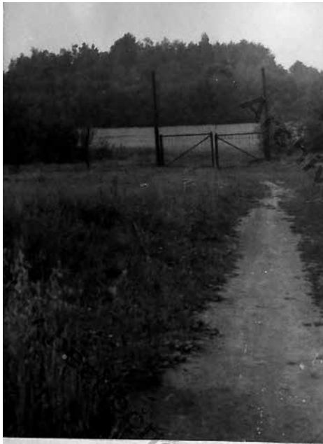
Přístupová polní cesta ze směru osady Studánky