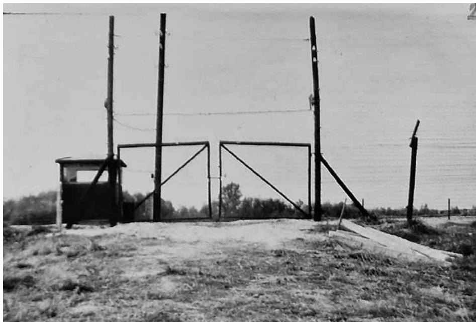
Obr. 6: Detailní pohled na strážní stanoviště, kudy Jiří Barteček převedl své dva kamarády a společně odešli do Rakouska (ABS, f. Správa vyšetřování StB – vyšetřovací spisy, arch. č. V-18596 MV, s. 170)