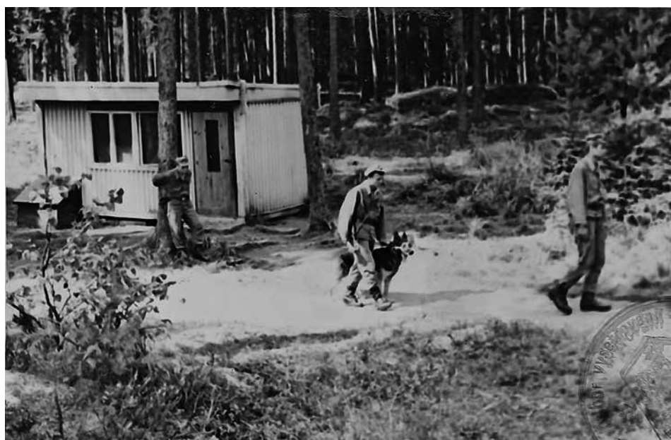
Obr. 8 a 9: Fotografie z rekonstrukce