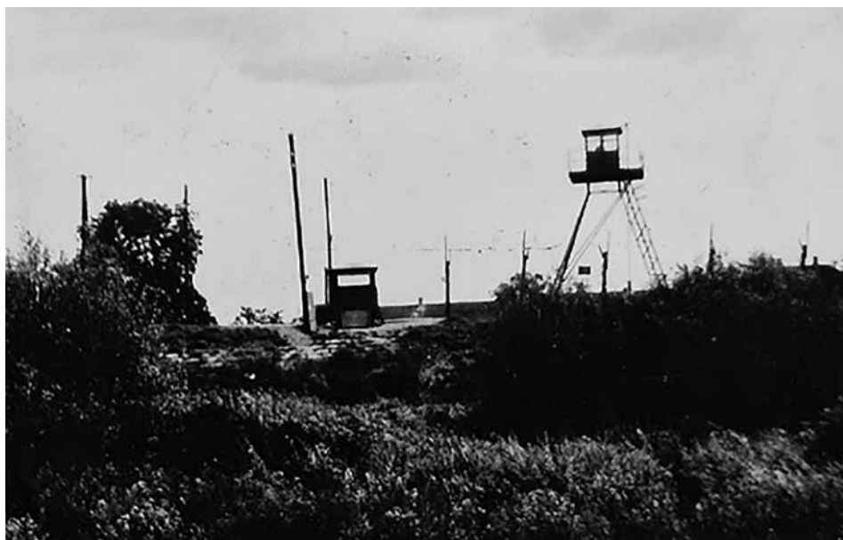
Obr. 5: Pohled na strážní stanoviště Pět vrb (ABS, f. Správa vyšetřování StB – vyšetřovací spisy, arch. č. V-18596 MV, s. 170)