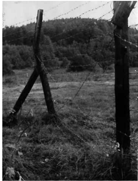
Sloupek po kterém jeden narušitel přešel a místo v DZ v kterém druhý narušitel prolezl

Obr. 2 a 3: Fotodokumentace místa Hodaňových přechodů (ABS, f. Správa vyšetřování StB – vyšetřovací spisy, arch. č. V-6533 OV, dokumentace narušení státní hranice)