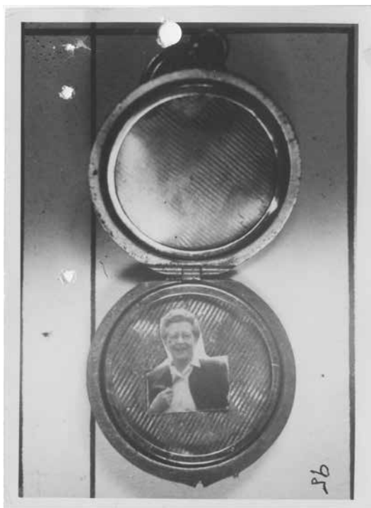
Obr. 12: Medailonek s portrétem Milady Horákové, který měl Karel Ryjáček doručit do ČSR (ABS, f. V-PL, sign. V-245 PL – část I)