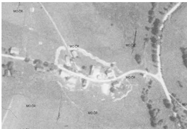
Obr. 2: Letecký snímek velitelského stanoviště 19. roty Kámen (1953). V okolí budov, jež tvořily rotu, jsou dobře patrné zákopy vnitřní obrany roty

V roce 1956 byl vybudován jedностěnný drátěný zátaras v úseku pohraničních rot Český Jiřetín, Mníšek, Brandov, Kalek a Hora Svatého Šebestiána 1. praporu Jirkov, kde do té doby žádný drátěný zátaras postaven nebyl. Dokončením drátěného zátarasu v délce 22 km byla státní hranice v celém úseku střeženém 3. karlovarskou brigádou uzavřena. 90 Vzhledem k dokončení drátěného zátarasu bylo od dubna