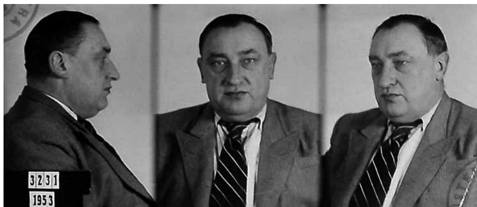
Obr. 16: Štěpán Trochta po zatčení v lednu 1953 (ABS, f. V-MV, arch. č. V-2309 MV)

kolísavá. Ve zprávě pro Ministerstvo spravedlnosti je uvedeno, že do září r. 1957 plnil normu na 100 %, potom na 84 % a ku konci roku už jen na 75 %, chování ve výkonu trestu má dobré a nebyl doposud kázeňsky potrestán. 83