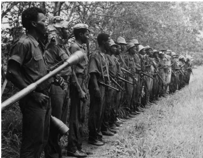
PAIGC 1966, jednotka pravidelné armády, nastoupená k bojovému rozdělení („pancéřovky“ jsou čs. původu)