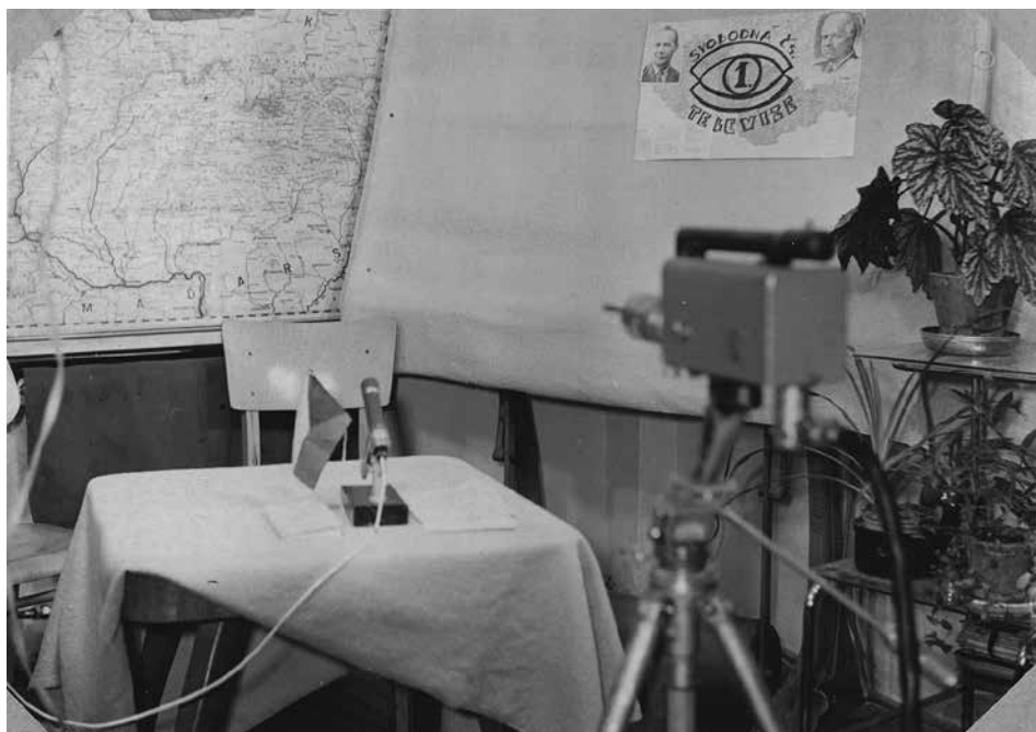
Obr. 1: Část improvizovaného studia na televizním vysílači Klet'

Dne 26. srpna většina z nich (v přestrojení za požárníky) přešla hranice s Rakouskem, kde jednali s rakouskou televizí a Radiem Linec o možnosti pokračovat v televizním vysílání.