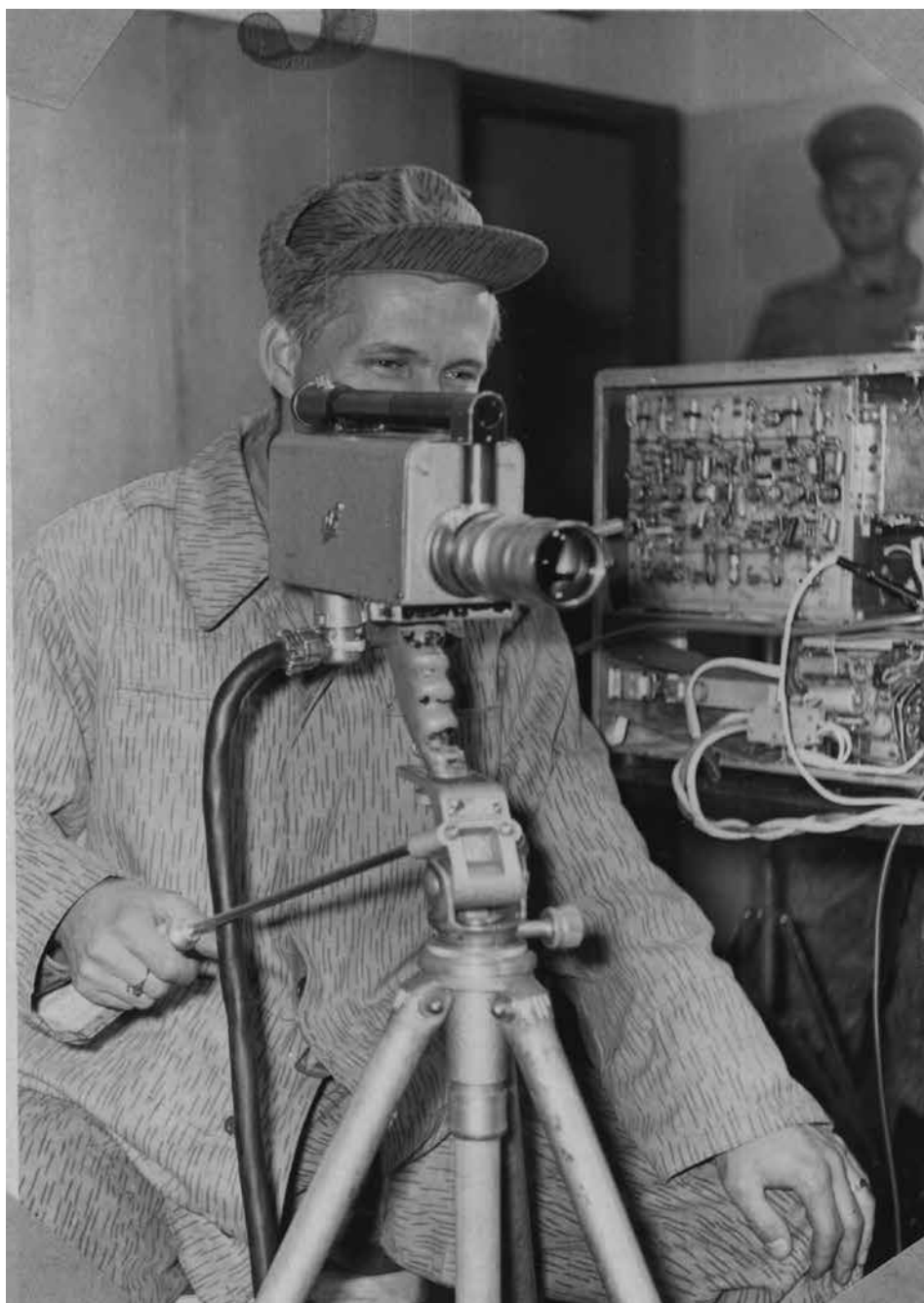
Obr. 2: Kameraman při práci