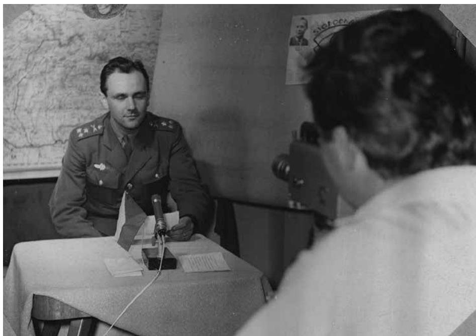
Obr. 3: Reportér při vysílání ze studia

Z archivní pomůcky Manipulační seznam 2. typu, dostupné na webových stránkách ABS 10 , jednoznačně vyplývá, že většina vyšetřovacích spisů Státní bezpečnosti byla vedena ke konkrétním osobám, a jsou tak dohledatelné i v dalších evidencích ABS. Část těchto spisů, které byly vedeny na neznámého pachatele, však v pomůckách dohledatelná není. Přepisy archivních protokolů Státní bezpečnosti často obsahují pouze základní popis (např. „havárie“, „anonym“, „hanobení republiky a jejího představitele“, „opuštění republiky“), a ačkoliv badatel má k dispozici uvedenou archivní pomůcku, bez přečtení konkrétního spisu nelze na první pohled poznat, čeho se dokumentace týká. Díky podrobnému zpracování části sbírky vyšetřovacích spisů České Budějovice se tak archivářům podařilo dohledat vyšetřovací spis akce Kleť, který je pro historiky zpracovávající toto období velice cennou archiválií. Část této sbírky bude po dokončení systematické digitalizace zpřístupněna v aplikaci eBadatelna.