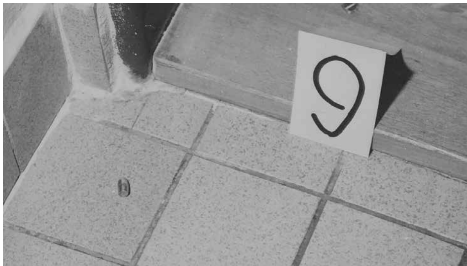
Obr. 5: Fotografická dokumentace pořízená na místě činu vyšetřujícími orgány – detailní pohled na nábojnici ráže 7,65 mm nalezenou u dveří vedoucích do šatny třetího oddělení jeslí, říjen 1985 (ABS, f. Správa vyšetřování StB – vyšetřovací spisy Brno, arch. č. V-14660 BN, 2. sv., č. listu 292)