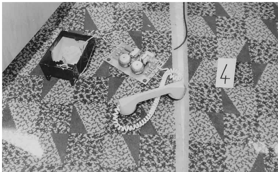
Obr. 04: Fotografická dokumentace pořízená na místě činu vyšetřujícími orgány – detailní pohled na rozbitý telefon, říjen 1985 (ABS, f. Správa vyšetřování StB – vyšetřovací spisy Brno, arch. č. V-14660 BN, 2. svazek, č. listu 285)