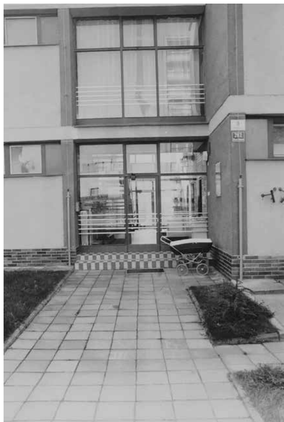
Obr. 2: Fotografická dokumentace pořízená na místě činu vyšetřujícími orgány – vchod do budovy jeslí, kde se celý incident odehrál, říjen 1985 (ABS, f. Správa vyšetřování StB – vyšetřovací spisy Brno, arch. č. V-14660 BN, 2. svazek, č. listu 283)