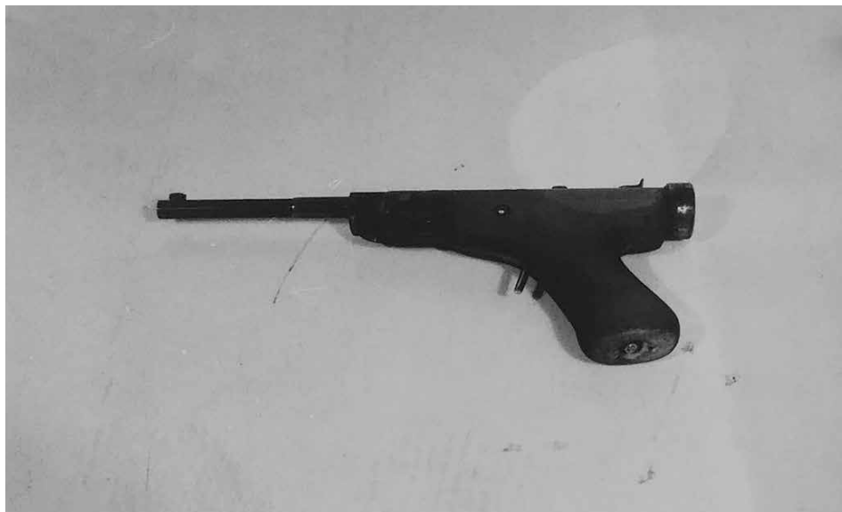
Obr. 7: Fotografická dokumentace věcí zajištěných na místě činu vyšetřujícími orgány – jednoranná vzduchová pistole čsl. výroby zn. Z, model ZVP, ráže 4,5 mm, kterou Ondřej Všečečka použil při násilném vniknutí do budovy jeslí, říjen 1985 (ABS, f. Správa vyšetřování StB – vyšetřovací spisy Brno, arch. č. V-14660 BN, 2. svazek, č. listu 297)