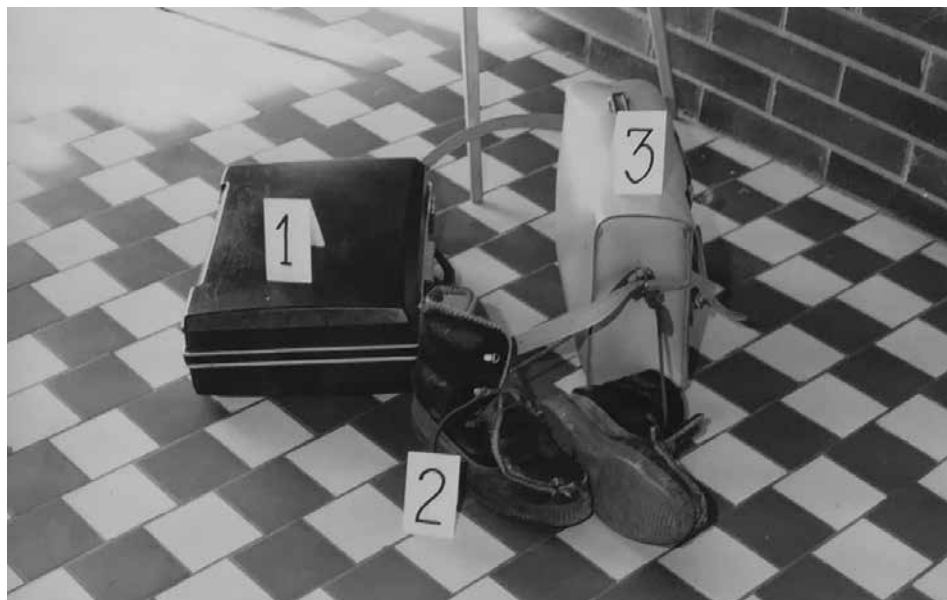
Obr. 3: Fotografická dokumentace pořízená na místě činu vyšetřujícími orgány – detailní pohled na diplomatický kufřík, boty a brašnu na nářadí, které Ondřej Všečetka zanechal ve vstupní hale jeslí, říjen 1985 (ABS, f. Správa vyšetřování StB – vyšetřovací spisy Brno, arch. č. V-14660 BN, 2. svazek, č. listu 284)