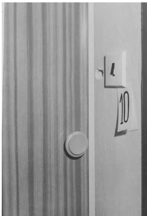
Obr. 6: Fotografická dokumentace pořízená na místě činu vyšetřujícími orgány – detailní pohled na díru po střele ve zdi vedle dveří do chodby vedoucí k umývárně, říjen 1985 (ABS, f. Správa vyšetřování StB – vyšetřovací spisy Brno, arch. č. V-14660 BN, 2. svazek, č. listu 290)