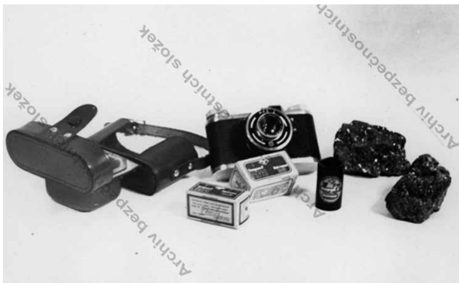
Obr. 7: Fotoaparát značky ILOCA a dva kousky rudy zabavené při prohlídce (ABS, f. V-MV, arch. č. V-2524 MV, sv. 1)