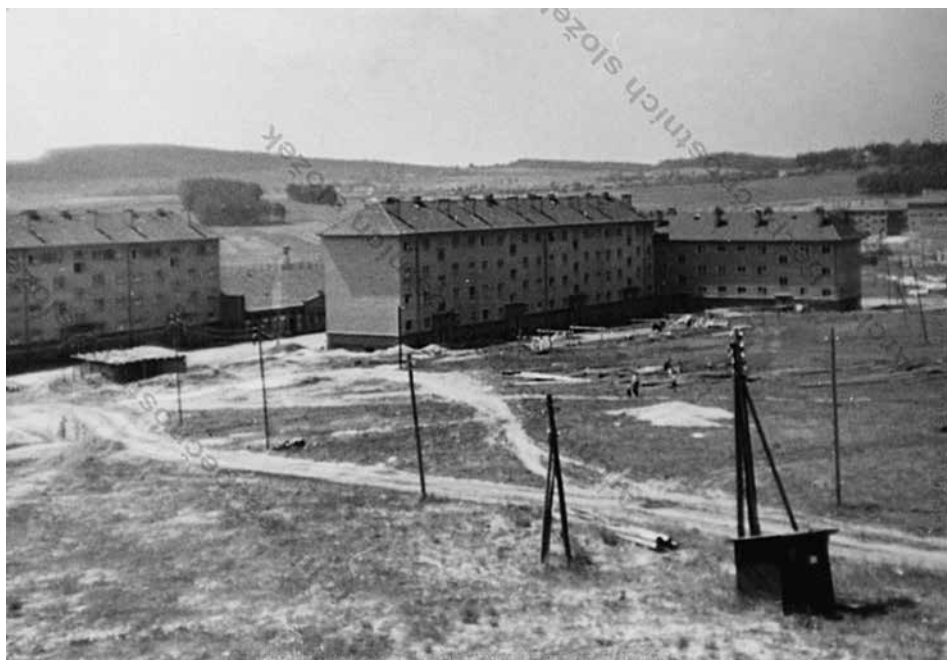
Obr. 6: Hornické sídliště v Příbrami ze dne 31. června 1955 (ABS, f. V-MV, arch. č. V-2524 MV, sv. 1)