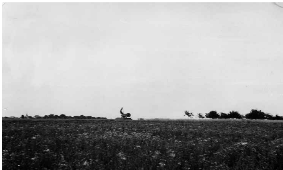
Obr. 9: Snímek radarové stanice, kterou během plavby vyfotil Vladimír Koblíček (ABS, f. V-MV, arch. č. V-2821 MV, sv. 1)