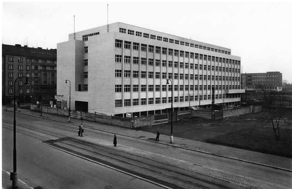
Obr. 2: V důsledku zaboru některých budov ústředních orgánů zaniklé republiky okupačními úřady získalo Ministerstvo vnitra novostavbu úřední budovy na Letné, která byla původně určena pro Nejvyšší ústřední kontrolní úřad. Změna určení si vyžádala některé stavební úpravy (NA, f. Ministerstvo vnitra I – nová registratura, kart. 5480, sign. P 1351)

bylo shledáno, že v rámci akce V bylo vítězství přáno ČSR a SSSR, přičemž někdy přibyl i srp s kladivem, popřípadě byl upraven vzhled poštovní schránky nápisy Ať žije SSSR a Smrt Hitlerovi . 79