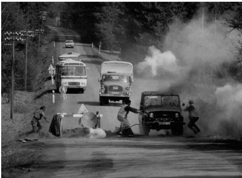
Obr. 2: Zneškodnění „pachatelů“ v rámci součinnostního cvičení Úder 84, uskutečněného dne 25. dubna 1984

součinnostních plánů, akceschopnosti příslušníků SNB a zdokonalení náčelníků a velitelů v rozhodování a velení při realizaci bezpečnostních akcí.