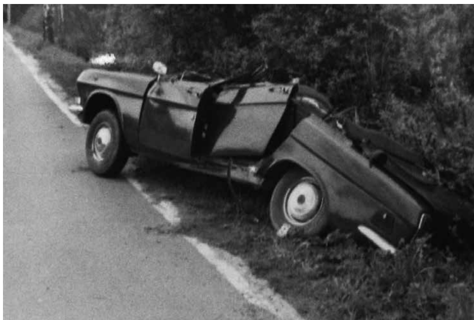
Obr. 3 Poškozená Volha po projetí pod závorou. (ABS, f. Vyšetřovací spisy – České Budějovice, arch. č. V-5600)