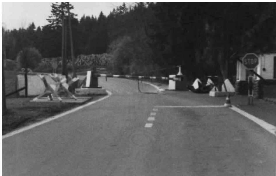
Obr. 2 Závora u signální stěny. Vpravo odtržená střecha. V pozadí vlevo poškozená Volha.