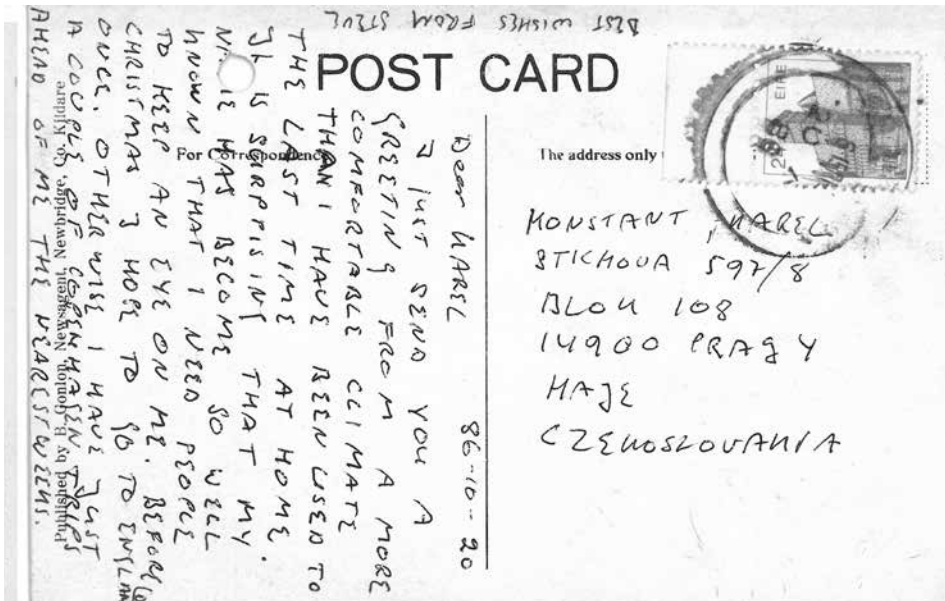
Poslední Jarvenova pohlednice zasláná pražské centrále ZSGŠ. (ABS)