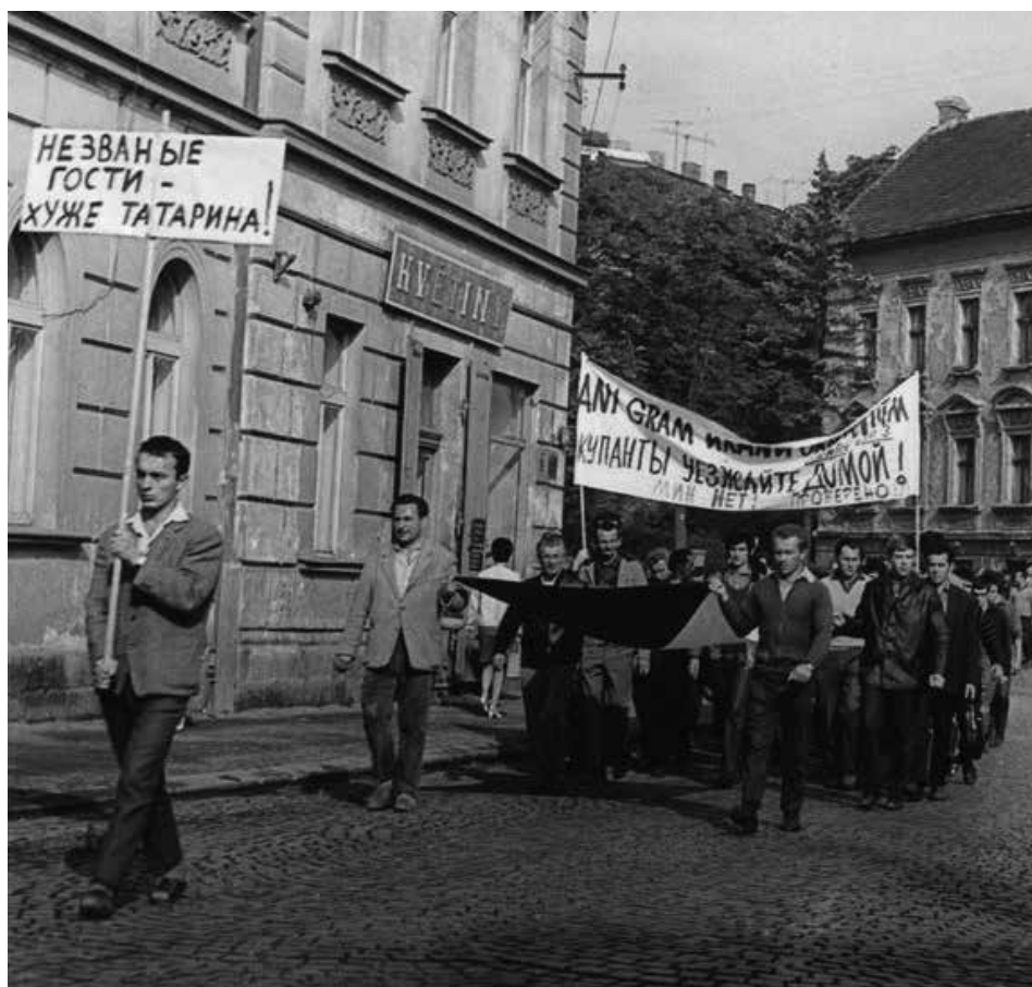
Ani gram uranu okupantům! – Okupanti, odjedte domů! – Nezvaní hosté, horší než Tataři!