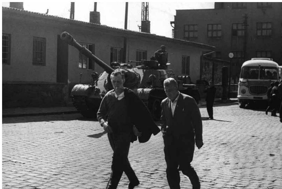
Okupační tank v areálu ČSAD Příbram.