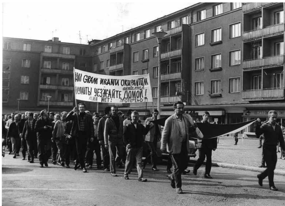
Horníci z dolu III UD procházejí 22. srpna 1968 náměstím na příbramském sídlišti.

K pomoci potlačení vzbouřených vězňů se nabídla i Sovětská armáda, její pomoc však byla „s díky“ odmítnuta. Potlačení vězeňské vzpoury se zúčastnily jednotky NVÚ, LM, VB a ČSLA. Pro úplnost je třeba podotknout, že soudní líčení s hlavními organizátory vzpoury se konalo až v roce 1970.