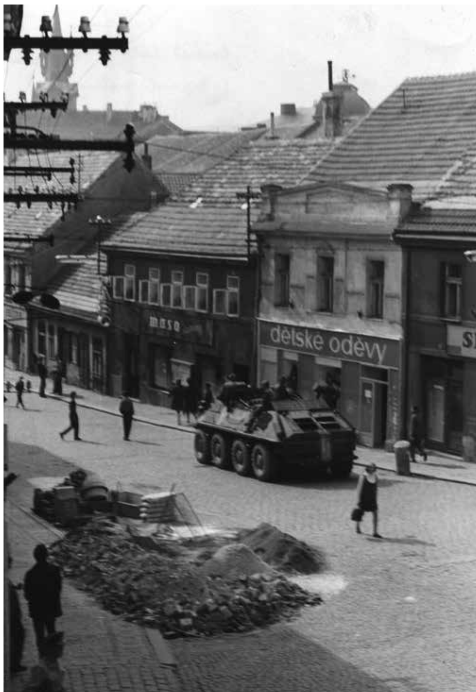
Sovětský obrněný transportér v Pražské ulici v Příbrami.