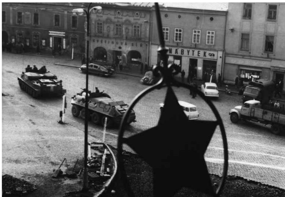
Sovětská vojenská technika v srpnu 1968 na náměstí Pionýrů (dnes T. G. Masaryka) v Příbrami.

„První sovětské okupační tanky se objevily v ulicích města navečer 21. 8. 1968. Tanky projížděly kolem strnule mlčících lidí na chodnících. Vojenská vozidla zaujala postavení na prostranství poblíž Uhelných skladů. Záhy po příjezdu prvních čtyř velkých tanků