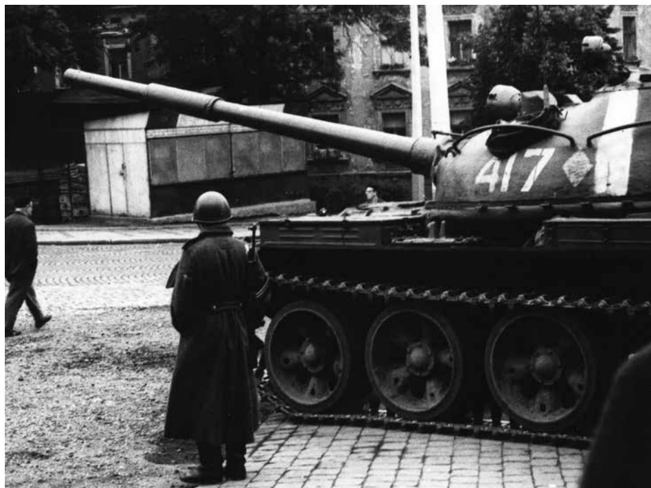
Tank sovětských okupantů před příbramským vlakovým nádražím.