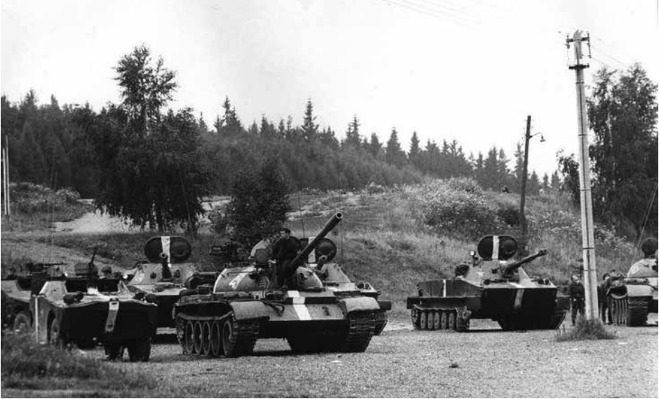
Sovětská vojenská okupační jednotka, která přijela jako první do Příbrami dne 21. srpna 1968, se usídlila na stadionu Baník Příbram u Litavky.