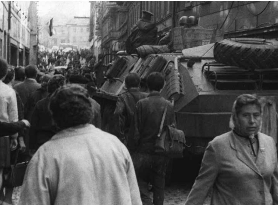
Sovětský transportér v Pražské ulici v Příbrami.