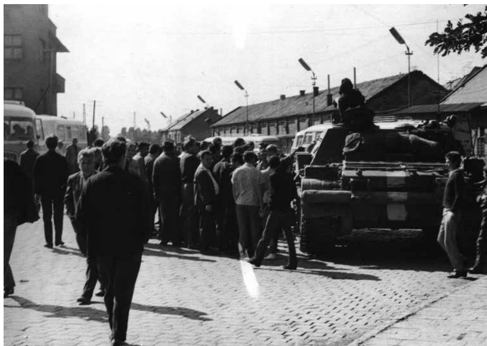
Okupační tank v areálu vlakového nádraží v Příbrami.