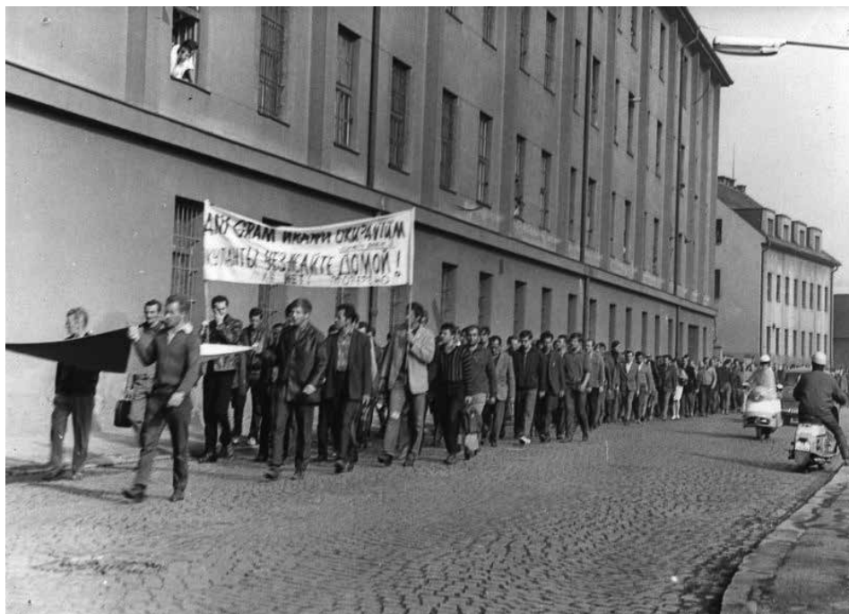
Protestní průvod horníků z dolu III UD.