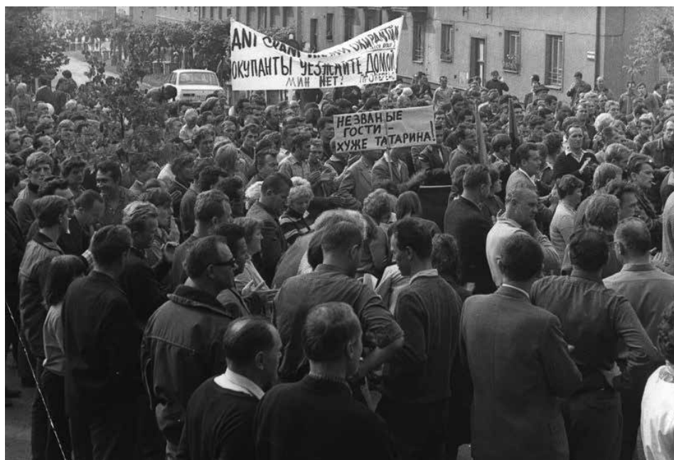
Horníci z dolu III UD před budovou generálního ředitelství Čs. uranového průmyslu.