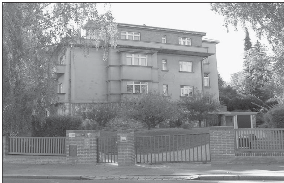
Dům v ulici Na Pískách, z jehož okna vyskočil Prokop Drtina při svém pokusu o sebevraždu.