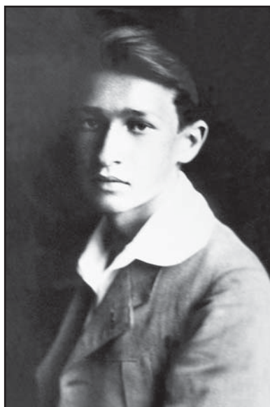
Mladý Prokop Drtina

Dne 1. května 1918 se Drtinovi podařil „první aktivní politický čin“, když dopoledne o přestávce pronesl ke svým spolužákům řeč a přiměl je k tomu, aby opustili školu a vydali se na tábor lidu na Střeleckém ostrově. Dne 28. října 1918 se pak se svým bratrancem Ivanem Herbenem účastnil velké protirakouské demonstrace na Václavském náměstí a stal se tak přímým svědkem vyhlášení samostatnosti Československa. Jako aktivní skaut (zásluhou otce byl skautem spolu se svou sestrou již od roku 1916) se dal okamžitě do služeb Národnímu výboru, pro který následně plnil kurýrní a strážní službu. Ve skautském stejnokroji se zúčastnil i slavného návratu T. G. Masaryka z emigra-