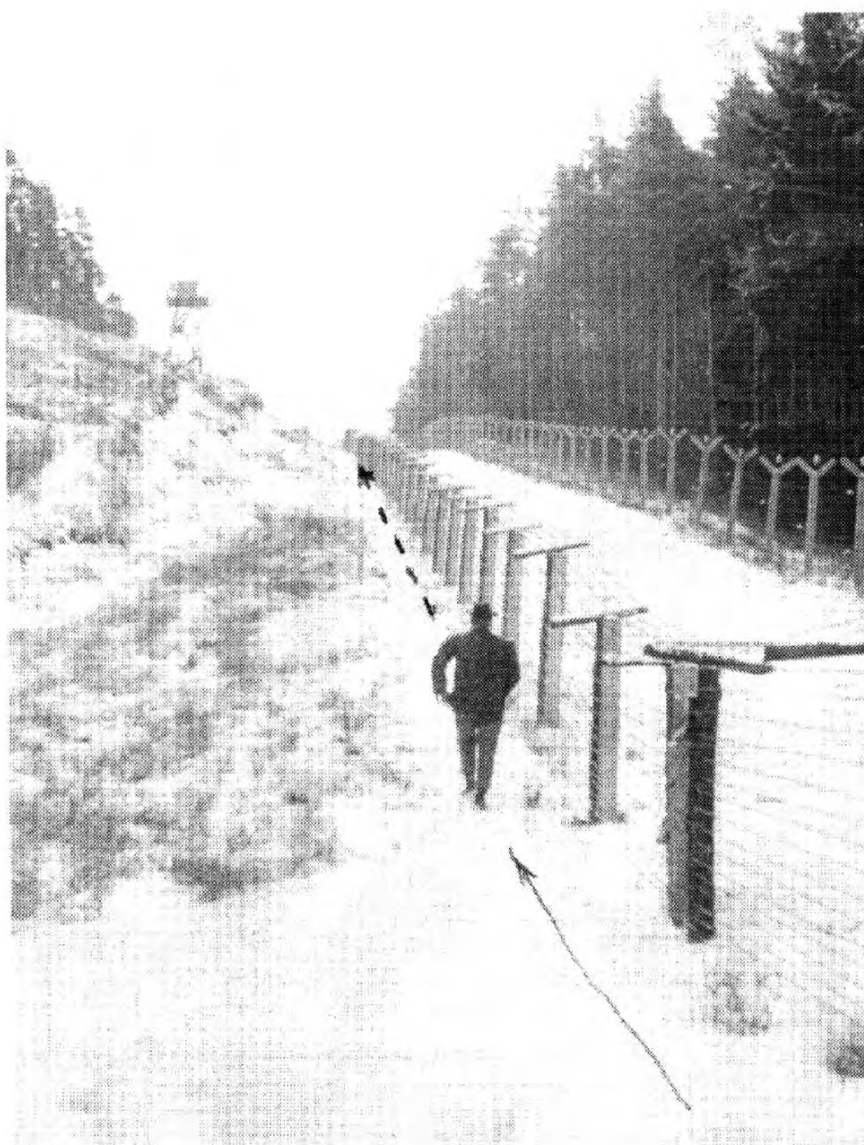
Úsek 12. roty Slapany, leden 1969, průsek, pozorovatelná, u lesa signální stěna, mezi stěnami kontrolní pás.